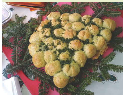
Pain artistiquement façonné en arbre de Noël

Un moment de partage et une expérience à refaire !